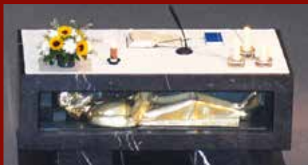
Nicolas de Flue à Sachseln