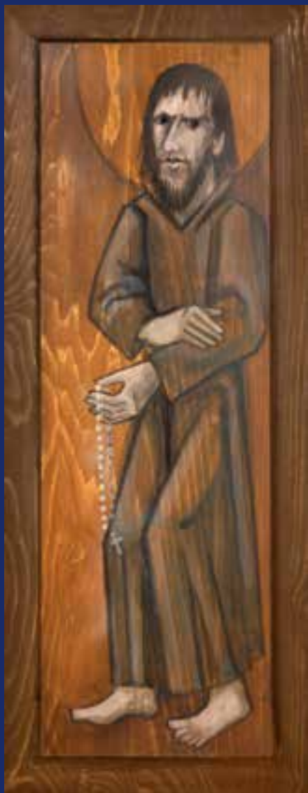
Nicolas de Flue de Sachseln / Suisse 1417-1487