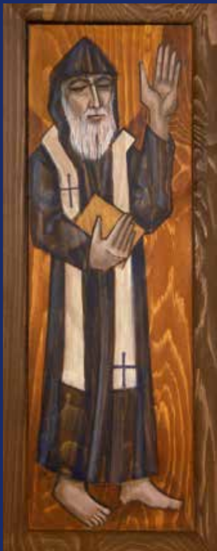
Charbel Makhlouf de Bekaa Kafra / Liban 1828-1898